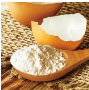
鶏卵の卵殻を原料とした天然の カルシウム素材を使用。

商品としていろいろな可能性があるとい われている安心安全な卵殻粉を原材料 として使用しています。