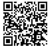
*工房だより Vol.8 : ボディ・コンディション・スコア